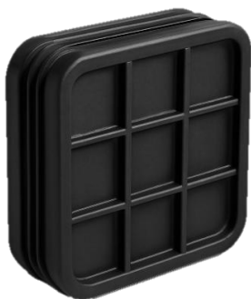
Socket/Spigot End Cap