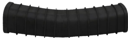
Quattro Bend (eksempelvis 15°)