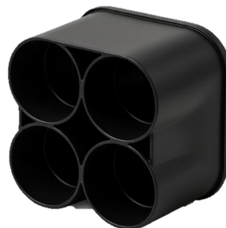
Single Duct Adapter